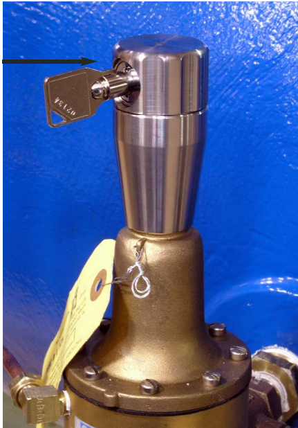
X140-1 Capuchón de Seguridad